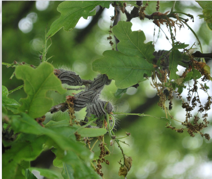
Foto: De rupsen uit het derde larvaal stadium knabbelen lustig aan de blaadjes.

Tijdens de controle op het veld merkten we op dat de meeste rupsen nog steeds in het tweede vervellingsstadium zitten. De rupsen in dit stadium bezitten nog geen brandharen en eten heel weinig. Een heel klein percentage is verveld naar het derde larvaal stadium. Vanaf het derde larvaal stadium veroorzaken de brandharen hinder. Let wel bij het derde larvaal stadium zitten de brandharen slechts op één segment van de rups. De werkelijke overlast ontstaat pas wanneer ze na de volgende vervellingen brandhaartjes op het gehele lijf dragen.